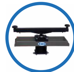
Macaco Pneumático central