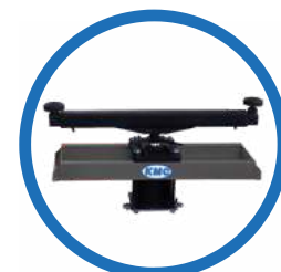
Macaco Pneumático central